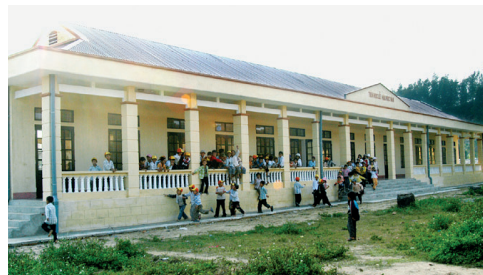
Des locaux flambant neufs pour accueillir les enfants de l'école primaire de Quang Thach.

Cette école primaire, qui avait subi de gros dégâts lors des tempêtes de septembre 2005, ne disposait plus que de huit salles de classe sur treize pouvant accueillir les enfants dans de bonnes conditions. Malgré les réparations effectuées par le Comité Populaire et les villageois, les salles de classe endommagées n'étaient utilisées qu'en saison sèche : des fuites importantes ne permettaient pas leur utilisation lors de la saison des pluies. Le problème est désormais résolu et rappelons que le projet a été réalisé grâce à la participation du Conseil Régional d'Indre-et-Loire et de Total. François Méchin, l'un de nos adhérents, est allé sur place se rendre compte du travail effectué.