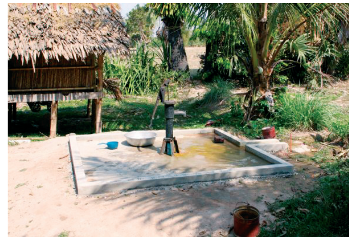
L'ensemble d'un puits se présente sous la forme d'une dalle cimentée de 5 m2, avec en son centre une pompe manuelle à levier, de manipulation très simple.

Si un Occidental, immergé depuis toujours dans le confort, est en capacité de concevoir que l'eau constitue bien l'élément essentiel de la vie, le fait d'observer, in situ, les effets produits par la réalisation d'un tel ouvrage dans un village démuné, crée incontestablement un moment émotionnellement fort.