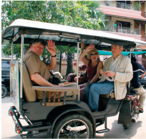
Un petit coucou de nos voyageurs dans un touk-touk, moyen de locomotion incontournable au Cambodge.