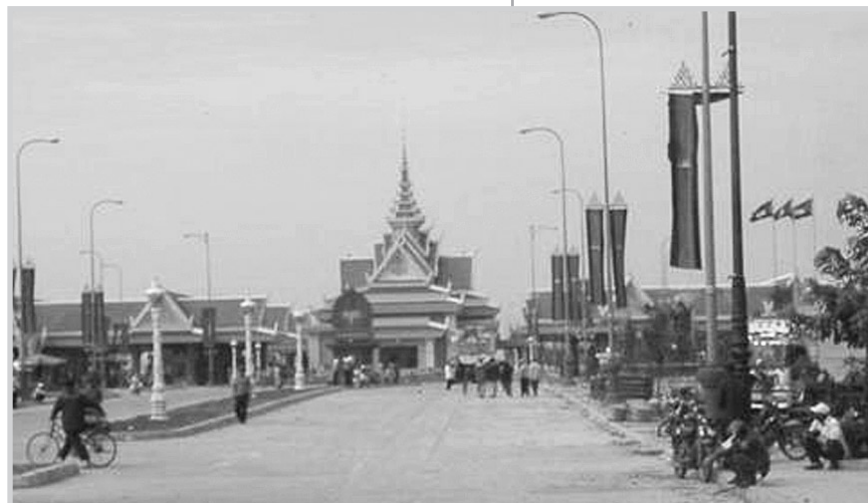
Victoire, c'est la frontière cambodgienne !