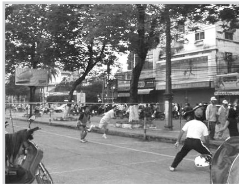
Au petit matin (6 h), une des parties de badminton autour du camping-car.

24 DÉCEMBRE 2005. Partis avec leur camping-car, le « P'tit Prince », de Blois (Loir-et-Cher), le 1 er mai 2005, ils ont parcouru 29.510 km en 7 mois et 23 jours en traversant notamment la Russie et la Chine. Huit mois d'aventures, d'émotions et de rencontres au cours d'un périple extraordinaire sur lequel nous reviendrons dans un prochain journal. En attendant, ils sont très occupés et ont déjà commencé leur travail pour EDR. Quel soulagement pour nous de les avoir sur place ! Merci et bravo à eux !